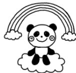
ぼんだグループ (3~5歳児) 火曜日

令和4年度の親子グループの活動に参加される乳幼児親子さんを大募集!!毎月3回程度、年齢別にリズム遊びや季節の製作遊びなどを行っています。また、全グループ合同の運動会や遠足なども予定しています。興味のある方はぜひ、見学にお越しください。