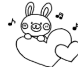
うさぎグループ (2歳児) 金曜日

♪令和3年度に引き続き参加される方も再度申込みが必要です。申込み用紙は児童館にあります。詳しくは児童館までお気軽にお問い合わせください。